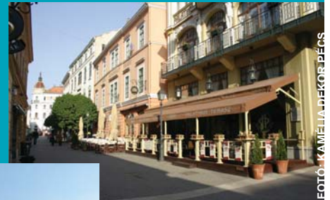
FOTÓ: KAMELIA DEKORPÉCS